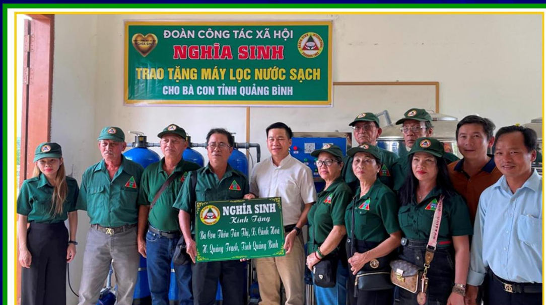
Nghi thức Trao tặng “Máy Lọc Nước Sạch” cho bà con vùng lũ lụt tại thôn Tân Thị, xã Cảnh Hóa, huyện Quảng Trạch, tỉnh Quảng Bình * Ngày 9/10/2022

http://www.truyen-tin.net/ViewPhotoGallery.aspx?tabid=123&mid=498&PhotoAlbumPK=567